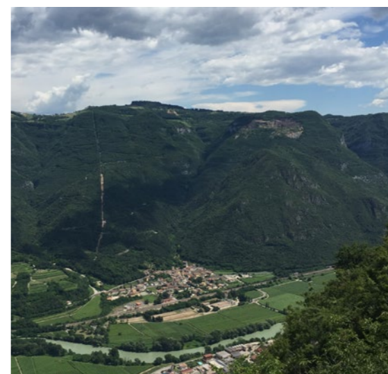
Panoramica di Peri

Il tratto dell'Adige che scorre lungo il territorio di Dolcè, particolarmente incontaminato, suggestivo e ricco sotto il profilo della flora e della fauna, è l'ideale per la discesa del fiume con canoa e gommoni. Qui, ogni terza domenica di ottobre si svolge Adigemarathon, maratona internazionale di canoa e kayak, che raduna centinaia di agonisti provenienti da tutto il mondo. Dalla suggestiva Isola di Dolcè, prende il via la pagaiata non competitiva degli appassionati che, a migliaia, in canoa e sui gommoni del rafting, seguono il corso della corrente fino al traguardo di Pescantina.