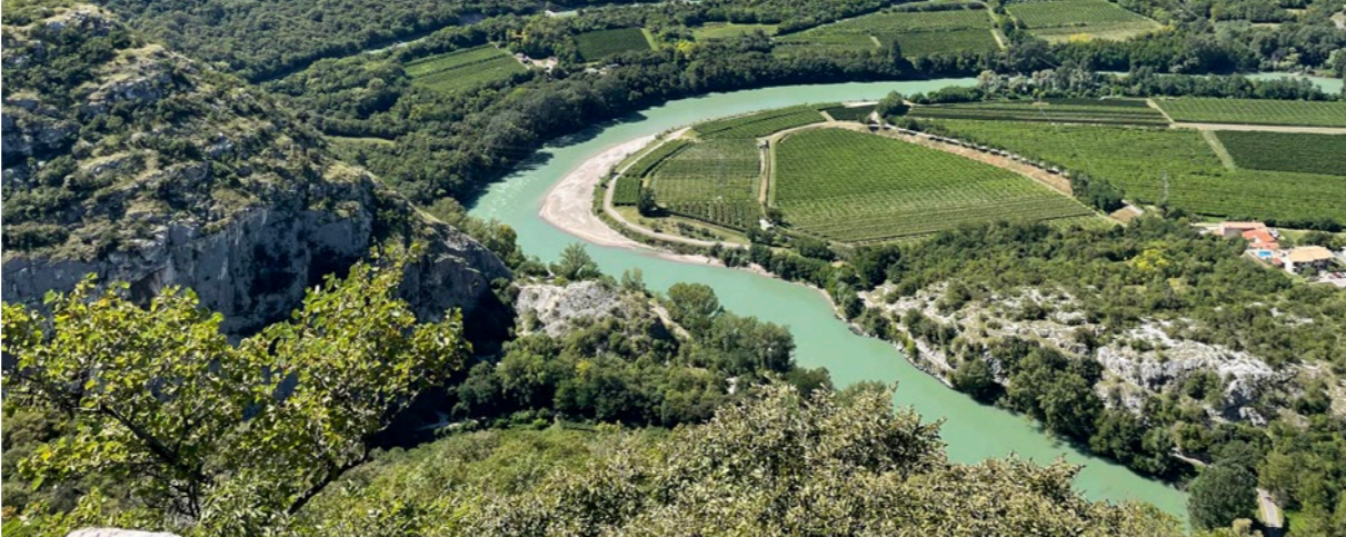
Ansa del fiume Adige (Ceraino)