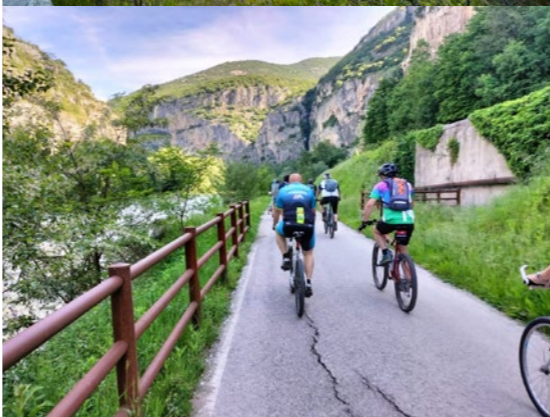
Percorso ciclabile lungo il fiume Adige